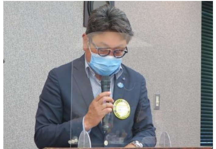
2020～2021年度・館林ロータリークラブ