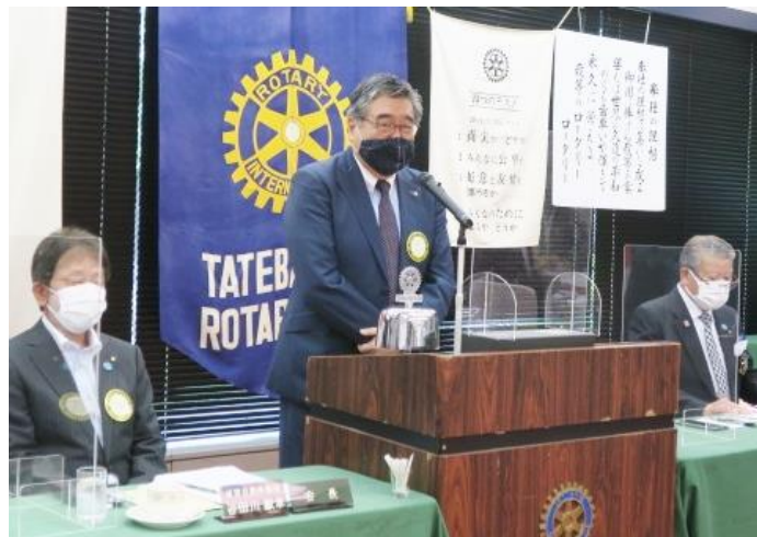
正田醤油 (株) 代表取締役社長 昭和 34 年生 趣味：食べ歩き、ゴルフ、美術鑑賞