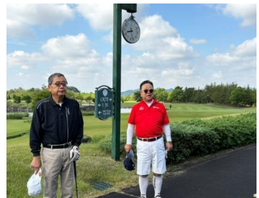
石川ゴルフ部会長 挨拶