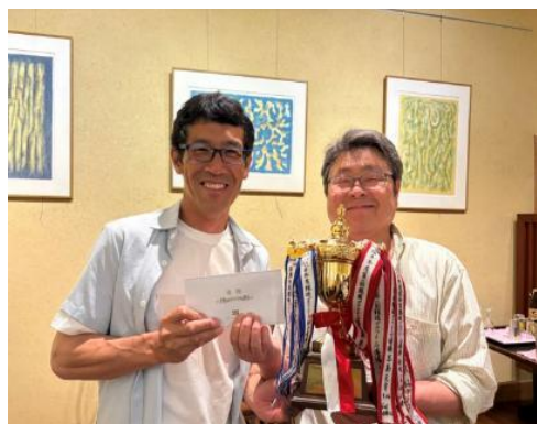
本日の優勝者・ベストグロ賞