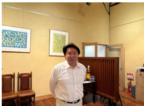
親睦委員長 場を温めてくれました！