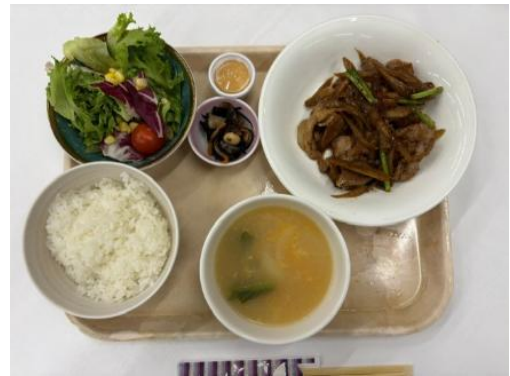
新ごぼうと豚肉のオイスター炒め