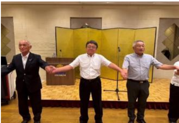
手に手つないで～ つくる友の輪～♪