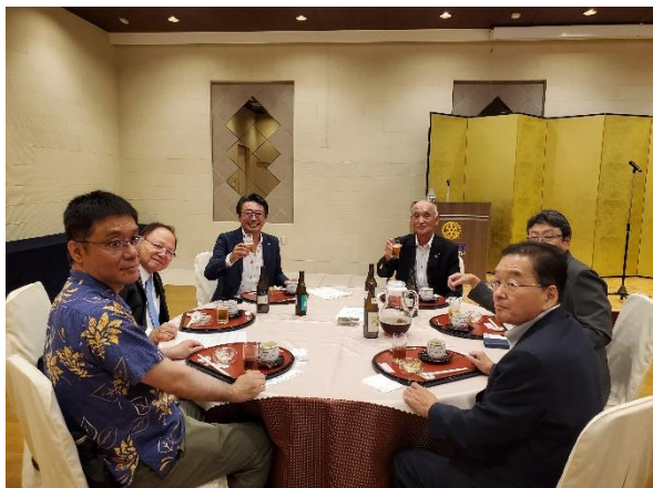
竹中ガバナー・原ガバナー補佐と 各クラブ会長の皆様