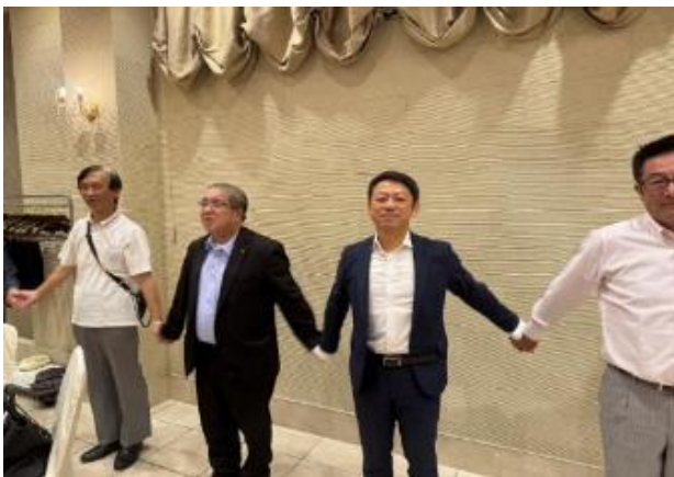
輪に輪つないで～ つくる友垣～♪