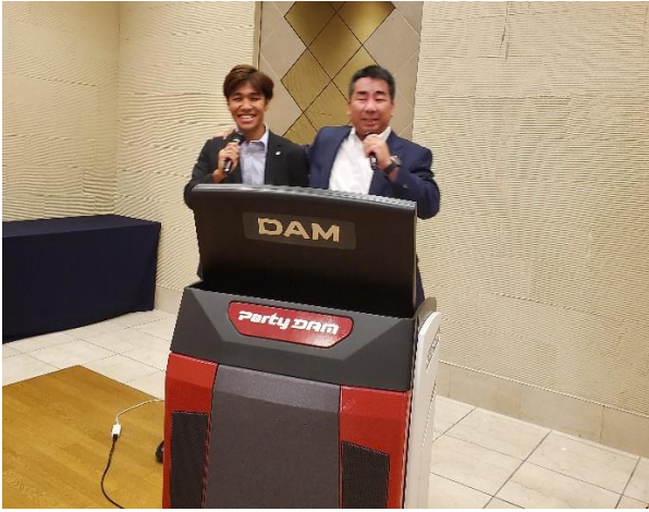
ニマくんと長柄会員で仲良くスピッツ♪