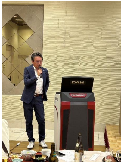
竹中ガバナー熱唱♪