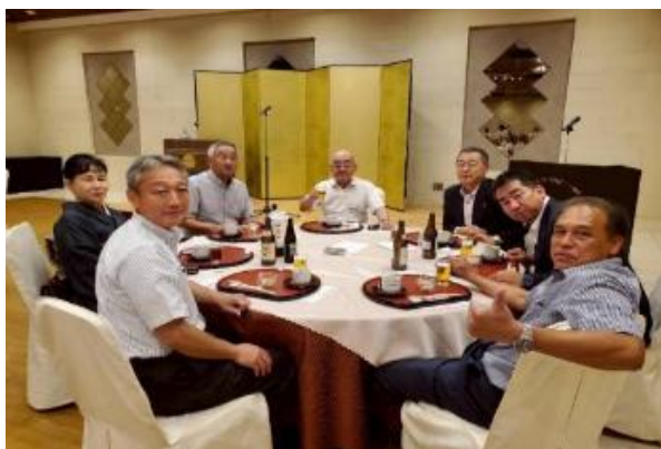
4クラブ合同で交流を深めて！