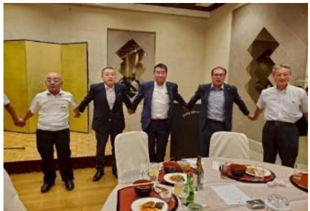
おおロータリア～ン おおロータリア～ン♪